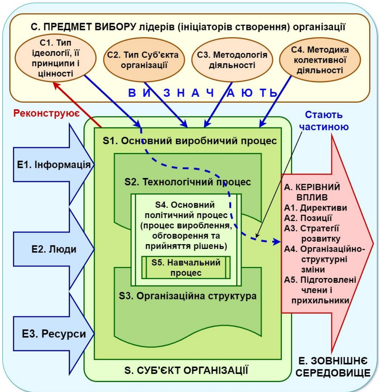
Схема 1. Функціональна модель політичної організації

цілому і кожну її складову зокрема з точки зору низки наукових підходів, які ми об'єднаємо у концептуальну мережу (див. нижче), що дозволить виробити і представити засади конструювання політичних партій нового покоління.